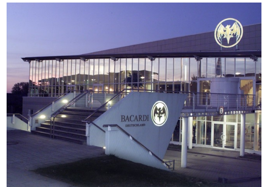
Abfüllanlage von Bacardi Deutschland

Karibischer Rum und Bacardi sind heute ein Synonym. Die Erfolgsgeschichte dieser Marke begann mit einer alten Brennerei 1862 auf Kuba. Heute ist Bacardi Ltd. ein Weltunternehmen mit Hauptsitz auf den Bermudas und operiert erfolgreich auf dem Markt für Premium-Spirituosen. Die deutsche Tochtergesellschaft Bacardi GmbH gehört zu den führenden Anbietern im Lande. Neben Klassikern wie Bacardi Rum und Martini Vermouth zählen viele andere bekannte Marken wie Jack Daniel's Tennessee Whiskey, Grey Goose Vodka oder Bombay Sapphire Gin zum Portfolio. In Deutschland beschäftigt Bacardi rund 300 Mitarbeiter und hat seinen Hauptsitz in Hamburg. In Buxtehude betreibt es mit 65 Mitarbeitern eine große Abfüllanlage.