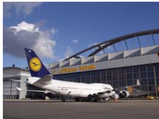
Lufthansa Technik AG Jumbo hal in Hamburg

Vanwege de vele internationale zakelijke betrekkingen heeft Lufthansa Technik AG behoefte aan een efficiënte toegang tot diverse informatiebronnen. De oplossing die eerder werd gebruikt bij Lufthansa Technik voor de toegang tot taalkundige woordenboeken en zakelijke woordenlijsten was verre van efficiënt. Vanwege het feit dat deze methode zich op het internet bevond, kon deze niet voldoen aan de strenge veiligheidsvoorschriften van het bedrijf. Andere oplossingen voor informatietoegang waren erg langzaam in gebruik door weinig gebruiksvriendelijke software.